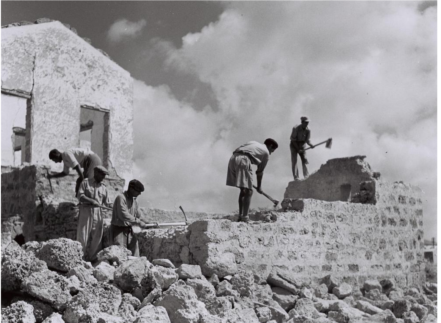
Ouvriers juifs démolissant des maisons à Jaffa après la bataille de 1948 qui a vidé la ville de presque tous ses habitants palestiniens, 6 octobre 1949.

Un exemple de premier plan de ce racisme est visible dans le blog de nouvelles Carmel des années 1960, qui décrit les tentatives de la municipalité de Tel Aviv pour déloger les habitants de Manshiyye, le quartier de Jaffa le plus au nord, dont les habitants palestiniens ont été chassés en 1948. Ce qui suit est une transcription d'un des blogs, issu du film d'Anat Even "Yizkor L'Manshiyye" [1] :