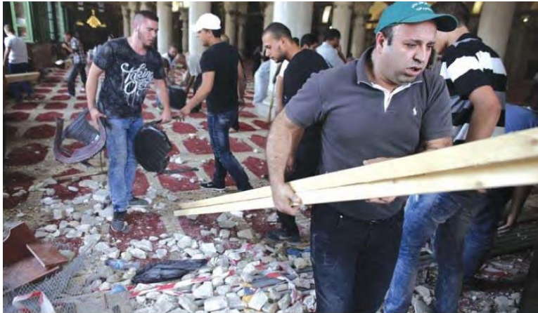
Des civils palestiniens font le nettoyage de la mosquée Al-Aqsa après l'assaut par les forces israéliennes.