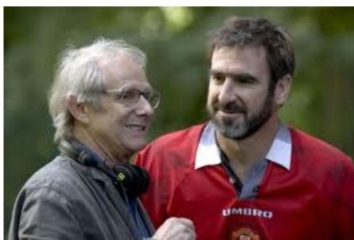
Ken Loach et Eric Cantona

Dans une lettre rendue publique à l'occasion de l'Euro de football, Éric Cantona, Noam Chomsky et Ken Loach observent avec satisfaction que « certains membres de gouvernements ont décidé de boycotter les matchs de groupe en Ukraine en raison des violations des droits humains observées dans ce pays. » avant de demander « pourquoi les mêmes acteurs sont-ils si silencieux quand Israël reçoit l'Euro 2013 des moins de vingt-et-un an ? Le racisme, les violations des droits de l'homme et les violations flagrantes du droit international sont des faits quotidiens dans ce pays. »