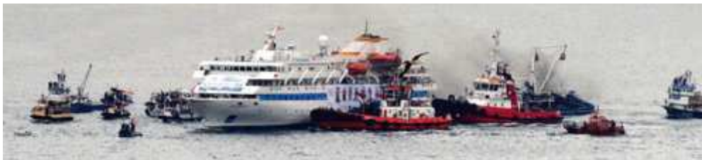
Le bateau civil humanitaire Mavi Marmara le 31 mai 2010, victime de l'assaut israélien

Que s'est-il passé ? Qui sont ces militants pro-Palestiniens ? Quelles étaient leurs motivations ? Et pourquoi ont-ils tenté encore à partir vers la même destination, fin juin 2011, plus nombreux encore, plus déterminés, malgré les menaces du gouvernement israélien ?